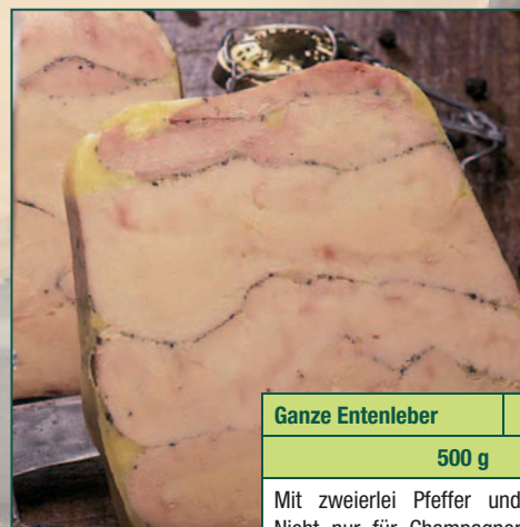
Ganze Entenleber 27644 500 g

Mit zweierlei Pfeffer und Champagner. Nicht nur für Champagnerfreunde. Halbkonservenschale.