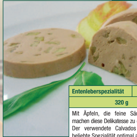
Entenleberspezialität 3106 320 g Mit Äpfeln, die feine Säure der Äpfel machen diese Delikatesse zu einem Erlebnis. Der verwendete Calvados rundet diese beliebte Spezialität optimal ab. Halbkonservenschale.