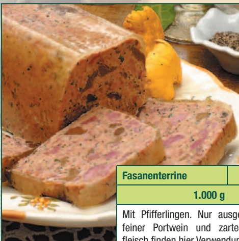
Fasanenterrine 5219 1.000 g Mit Pfefferlingen. Nur ausgesuchte Pilze, feiner Portwein und zartes Fasanenfleisch finden hier Verwendung. Halbkonservenschale.