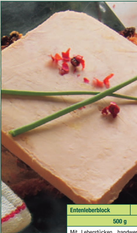
Entenleberblock 9914 500 g Mit Leberstücken, handwerklich perfekt. Halbkonservenschale.