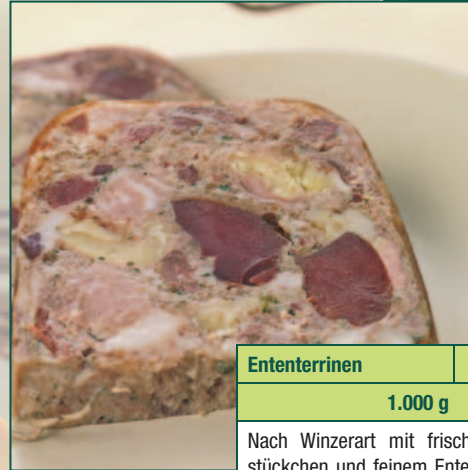
Ententerrinen 12022 1.000 g

Seit fünf Generationen hat ROUGIE sein Know-How und seine Kreativität verbunden, um hochwertige Gänse- und Entenleber herzustellen.