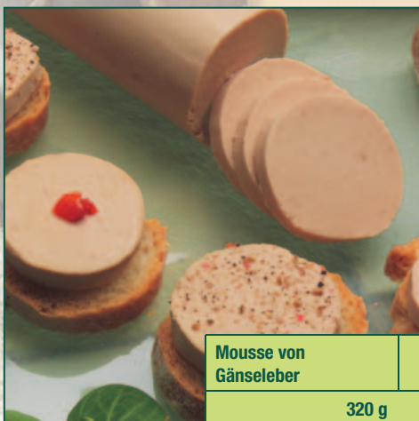
Mousse von Gänseleber 25253 320 g

Mit 30% Leberstücken. Der absolute Klassiker. Halbkonservenschale.