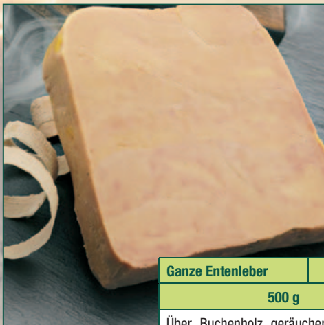
Ganze Entenleber 27093 500 g

Nach Winzerart mit frischen Kastanienstückchen und feinem Entenfleisch, abgeschmeckt mit Rotwein und Echalotten.