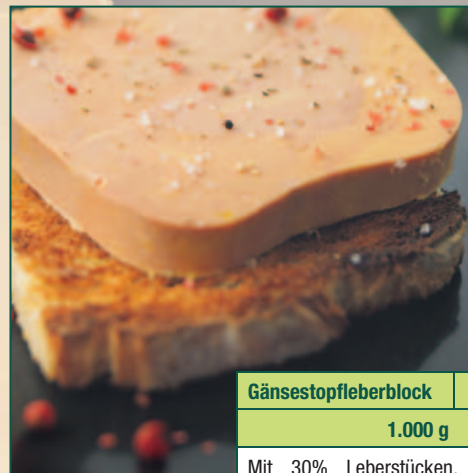
Gänsestopfleberblock 11186 1.000 g

Über Buchenholz geräuchert, aromatisch feinstes Raucharoma.