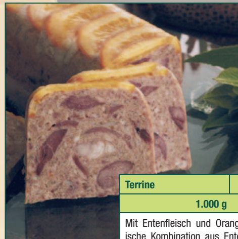
Terrine 4395 1.000 g Mit Entenfleisch und Orangen, die klassische Kombination aus Ente Orange. Verfeinert mit Cointreau. Halbkonservenschale.